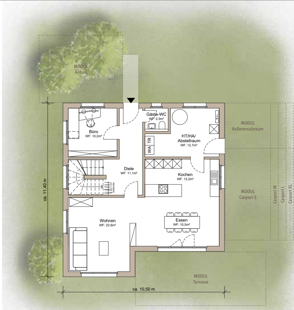
Erdgeschoss WF: 85,4 m 2